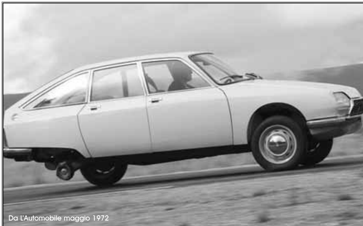
Da L'Automobile maggio 1972